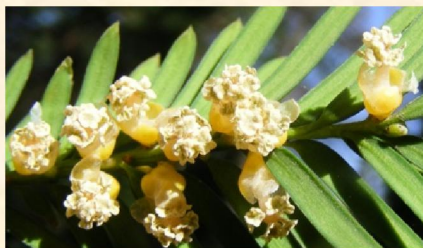
Fleurs mâles 23/03/2010