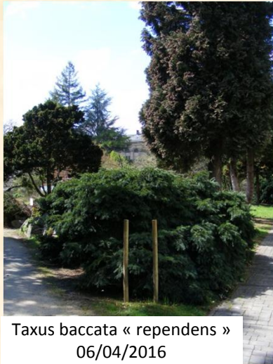
Taxus baccata « repens » 06/04/2016

Nom commun : If commun Famille des Taxacées Origine : Eurasie et Afrique du Nord